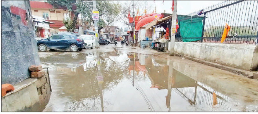
रेवाड़ी। बड़ा तालाब हनुमान मंदिर की सड़क पर जमा सीवर का गंदा पानी।

पानी जमा हो गया, जिससे श्रद्धालुओं को परेशानी का सामना करना पड़ा। नगर परिषद की ओर से गत वर्ष नवंबर माह में करीब 45 लाख रुपये की लागत से बड़ा तालाब की सड़क का निर्माण किया गया था। सड़क बनाने से पहले जलभराव की समस्या से निपटने के लिए 12 इंची ड्रेनेज पाइप लाइन डालकर चेंबर बनाए गए थे, लेकिन विभाग पानी की निकासी के लिए पाइप लाइन का आगामी लाइन में कनेक्शन करना भूल गया, जिससे समस्या ज्यों की त्यों बनी रही।