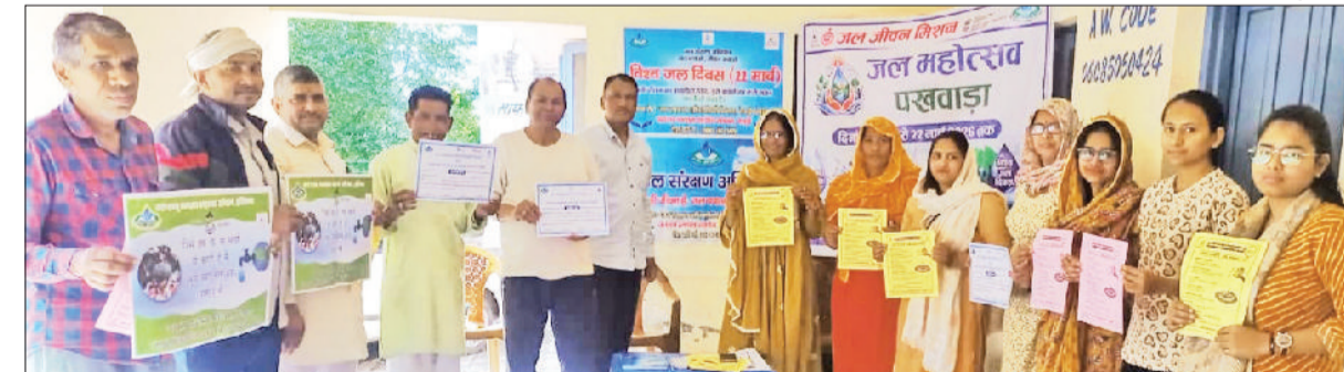
रेवाड़ी। विश्व जल दिवस पर ग्रामीणों को जागरूक करते हुए टीम।