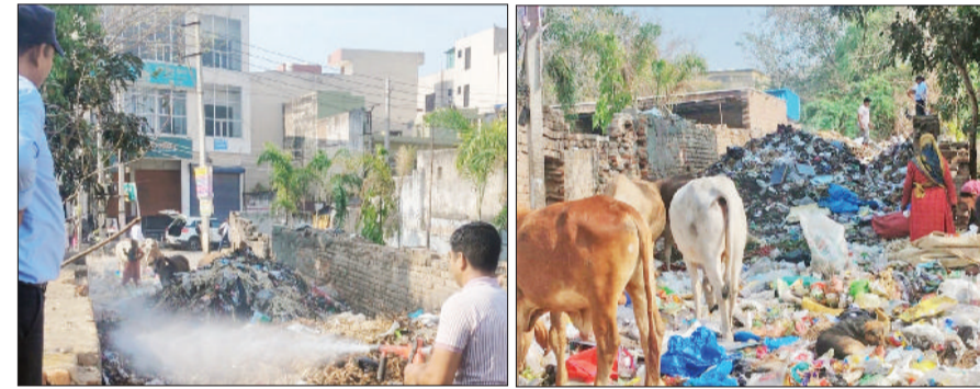
रेवाड़ी। ट्रामा सेंटर में कचरे में लगी आग बुझाना फायरकर्मियों, ट्रामा सेंटर के पास कचरे में मुंह मारते पशु।

शहर में कचरे में आग लगाना आम बात हो गई है। सफाई व्यवस्था बनाने के जिम्मेदार लोग कचरा उठाने की बजाय उसमें आग लगाकर वही निपटारा कर रहे हैं, जिससे वातावरण प्रदूषित होने के साथ लोगों को परेशानी का सामना करना पड़ रहा है। आग ज्यादा भड़कने पर लोगों को फायर ब्रिगेड भी बुलानी पड़ रही है। रविवार को सरकुलर रोड स्थित ट्रामा सेंटर के पास बने कचरा डंपिंग प्लांट में डाले गए कूड़े में आग लाग दी गई, जिससे धुआं फैलने से ट्रामा सेंटर में मरीजों को परेशानी का सामना