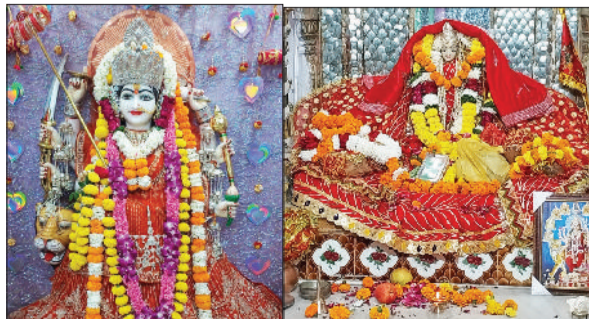
रेवाड़ी। बारा हजारी मंदिर में माता का किशोरा भव्य श्रृंगार, बड़ा तालाब मंदिर में सजी मंसा माता की प्रतिमा।

ये अष्टभुजा देवी के नाम से भी विख्यात हैं। इनके सात हाथों में क्रमशः कमंडलु, धनुष, बाण, कमल-पुष्प, अमृतपूर्ण कलश, चक्र तथा गदा हैं। आठवें हाथ में सभी सिद्धियों और निधियों को देने वाली जप माला है। मां का वाहन सिंह है। मां कूष्मांडा की उपासना से भक्तों के समस्त रोग-दोष मिट