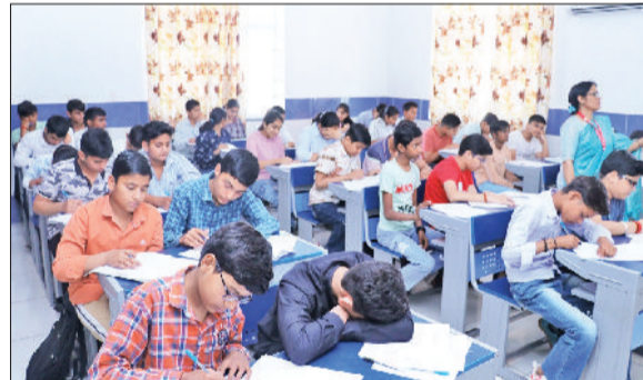
रेवाड़ी। राज स्कूल में स्कॉलरशिप परीक्षा देते विद्यार्थी।