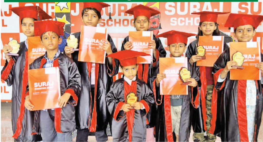
रेवाड़ी। ग्रेजुएशन सेरेमनी में उपस्थित नव्हे बच्चे।