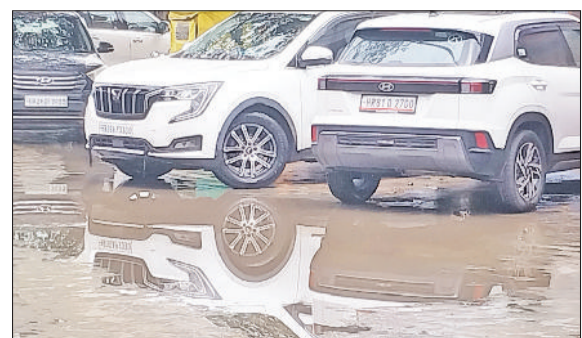
रेवाड़ी। मंदिर के सामने सड़क पर जमा सीवर का गंदा पानी।