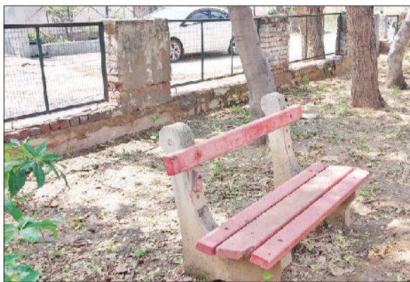
रेवाड़ी। सेक्टर-3 पार्क की टूटी चारदीवारी, गिरने की हालत में पेड़ तथा पार्क में टूटी हुई बैठने की बेंच।